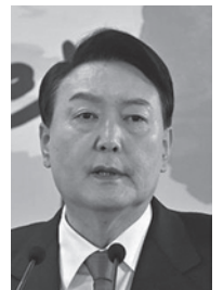
Yoon Suk Yeol Presiden Korsel