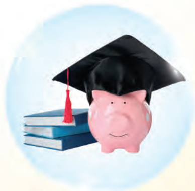
Biaya pendidikan untuk anak