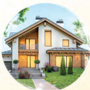
Rumah & tanah