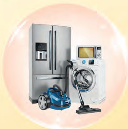
Peralatan rumah tangga