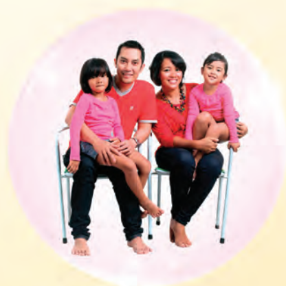
Pengiriman uang untuk yang tercinta