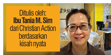
Ditulis oleh: Ibu Tania M. Sim dari Christian Action berdasarkan kisah nyata

Setelah bekerja dua (2) tahun dengan majikan pertamanya, Lusya diperkenalkan kepada seorang majikan baru. Pada saat interview, Lusya dijelaskan bahwa selain pekerjaan rumah tangga, Lusya juga harus menjaga anak majikan yang berumur sekitar 5 tahun. Lusya menemukan masalah paling besar ketika bekerja adalah dia diharuskan untuk menggendong anak majikan ketika berada di luar rumah.